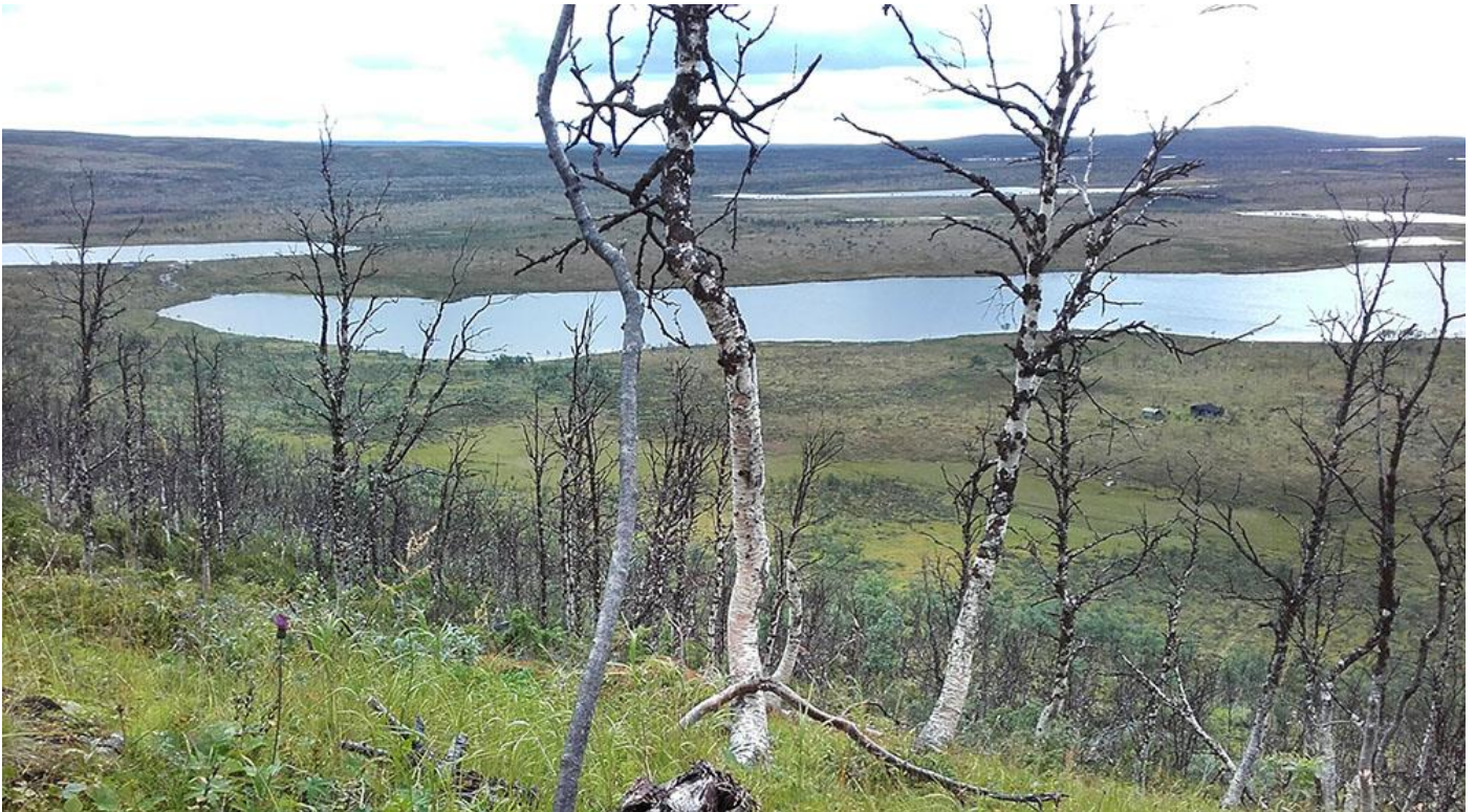
Suoldnemihtároasut Gálddoavvi meahceguovllus Ohcejogas.

goahcevuovderájá sirdašuvvan duottarguovlluide ja jalgadasa miesttaluvvan. Lagešvuovderoasut šaddet dábáleabbon, go garra dálvebuollašiid geahppánettiin ođđa beaiveloddešlájat levvet guvlui. Muohtaáigi oadnu, mii dahká jasad viidodaga gáržuma. Duollu hedjonettiin duollu gáibidan luonddutiippaid dilli hedjona.